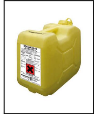
2 Kanister Schaummittel