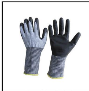
30 Paar Handschuhe