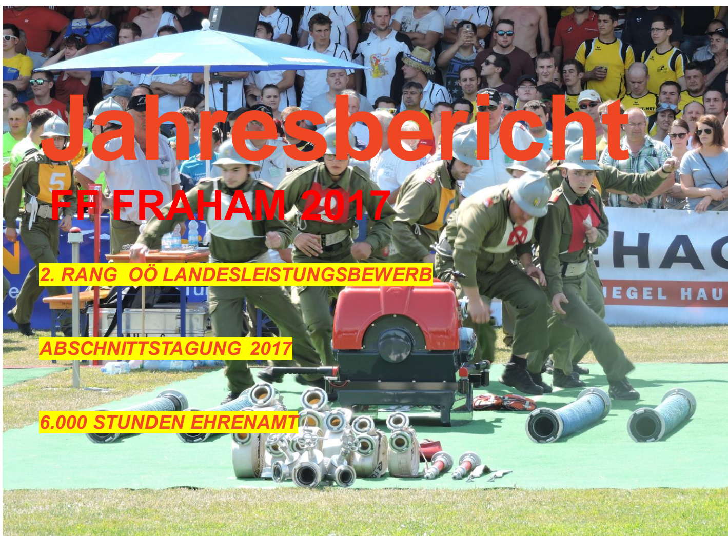
Wettkampfgruppe Aktiv Fraham1 beim Löschangriff / Landesbewerb 2017